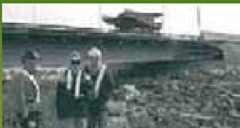
Gonjht'èkò gots'q njht'èchi