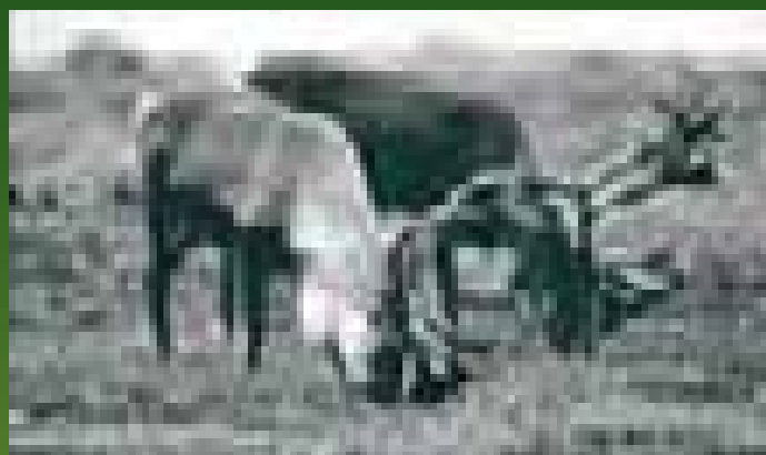
BHP Billiton Canada Inc. wenjht'èchi