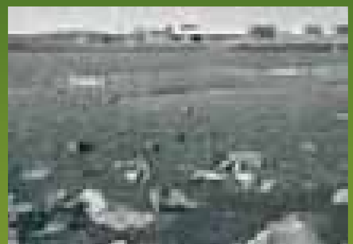
Gonjht'èkò gots'q njht'èchi